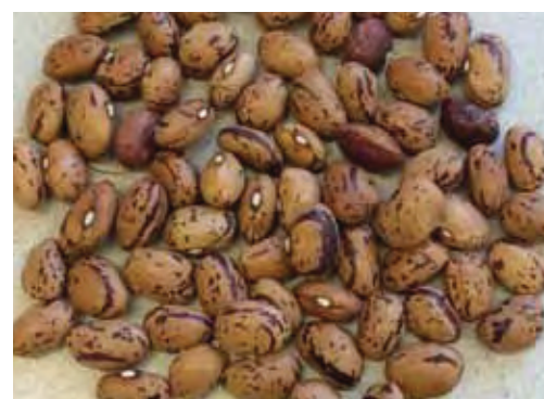
'Borlotto Rosso': Höchster Ertrag, aber etwas geringere Standfestigkeit als die ähnliche 'Big Borlotto'