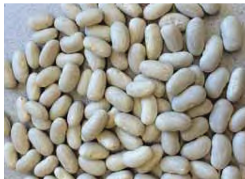
Die weiße Sorte 'Michelet' zeichnete sich durch hohen Ertrag und Feldhaltbarkeit aus

Die Zahl der vegan oder vegetarisch lebenden Bevölkerung nimmt kontinuierlich zu. Damit verbunden ist ein gesteigerter Bedarf an natürlichen Proteinquellen. Aber auch durch die Übernahme von Nahrungsgewohnheiten anderer Kulturen wird die Trockenbohne immer gefragter. Gerade in Mittel- und Südamerika ist sie für eine ausgewogene Ernährung unverzichtbar. In Österreich spielen die Käferbohne sowie rote und weiße Typen, die als Konservenbohnen genossen werden, eine Rolle. Die angebotenen Trockenbohnen stammen meist aus Asien, eine Sortimentsentwicklung einheimischer, ertragsstabiler Bohnen würde diese Versorgungslücke schließen. Die Vielfalt an verschiedenen Bohnensorten kennt jedenfalls kaum Grenzen, besonders auf die Größe, Form und Farbe bezogen. Somit ist es auch möglich, eine gewisse optische Abwechslung auf den Teller zu bekommen. An der Versuchsstation Wies wurden 2015 elf verschiedene Sorten Buschbohnen gesichtet: