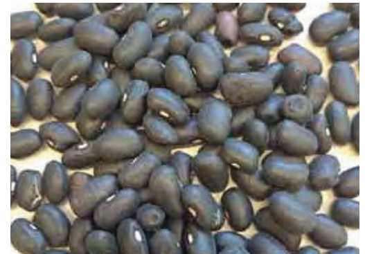
'Black Turtle': empfehlenswerte Sorte mit sehr später Blüte

Große Unterschiede waren ebenfalls in der Anzahl der Hülsen pro Pflanze zu beobachten. 'Black Turtle' besaß