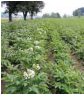
Noch keine Krautfäule am 21. Juli 2014, links Agria, eine Reihe (blühend) Venusz Gold, daneben eine Reihe Hopehely, restliches Feld rechts Ditta

Seehöhe: 650 m Bodentyp: Braunerde/Felsbraunerde Bodenart: lehmiger Sand Versuchsanordnung: Streifenversuch Vorfrucht: W-Gerste, ZF: Einj. KG Bodenbearbeitung: Pflug, 2 x Kreiselegge Aussaat: 06.05.2014 Pflege: Striegeln, 2 x Häufeln, 2 x Cu Düngung: Mist im Herbst Ernte: 18.09.2014 Versuchsbetreuung: Biokompetenzzentrum Schlögl