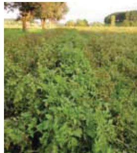
Hohe Krautfäule-resistenz bei Venusz Gold – Pflanzen noch weitgehend grün. Links daneben Agria, rechts daneben eine Reihe Hopehely, Rest: Ditta, 19. August 2014