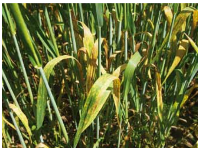
Gelbrost lässt sich im Biolandbau nur über die Wahl resistenter Sorten vorbeugend vermeiden.

Auch die Wahl der richtigen Sorte ist im Biolandbau ein Grundpfeiler des pflanzenbaulichen Erfolgs. Über die Nutzung der vorhandenen Krankheitsresistenzen lassen sich viele Pflanzenschutzprobleme vorbeugend lösen.