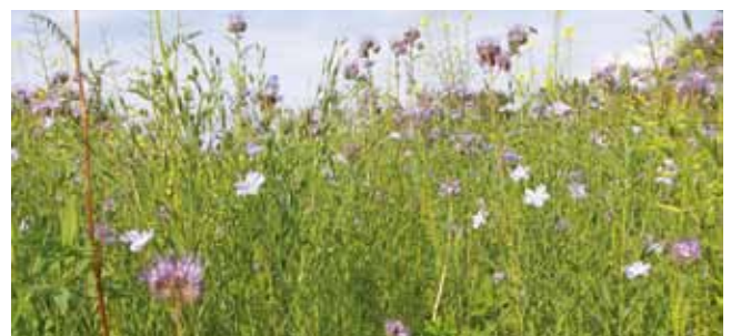
Als Begrünung sollten immer (möglichst vielfältige) Gemenge angebaut werden.

ACHTUNG: Pflanzenarten, die regelmäßig als Hauptfrucht im Betrieb angebaut werden, sollten nicht zusätzlich auch im Begrünungsanbau zum Einsatz kommen. Dies betrifft im Besonderen Körnerleguminosen.