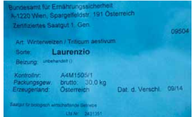
Die Saatgutetikette dient als Nachweis für den Einsatz von Biosaatgut und muss für die Biokontrolle aufbewahrt werden!

ACHTUNG: Im ersten Umstellungsjahr dürfen Sie kein Eigennachbausaatgut einsetzen (es handelt sich um konventionelles Saatgut), außer es ist am Markt kein Biosaatgut verfügbar.