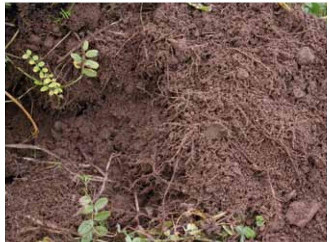
Über einen möglichst engen Wurzel-Bodenkontakt mit entsprechend großen reaktiven Oberflächen werden von der Wurzel Assimilate in die Rhizosphäre abgegeben und im Gegenzug Bodennährstoffe mobilisiert und aufgenommen.

Für den Einsatz im Biolandbau zugelassene schwerlösliche mineralische Düngemittel sind im jährlich aktualisierten Biobetriebsmittelkatalog gelistet. Mineralische Ergänzungsdünger sollten nur nach Bodenuntersuchung und eventuell in Verbindung mit einer Blattanalyse bei Vorliegen einer Mangelsituation eingesetzt werden. Häufig sind Mangelsituationen für die Kulturpflanze eine Folge von Bodenverdichtungen und schlechter Durchwurzelbarkeit am Standort. Aufgrund des Fehlens leichtlöslicher Mineraldünger kommt im Biolandbau der Ausbildung einer möglichst großen Wurzelmasse – in Verbindung mit einer Mykorrhizierung der Feinwurzeln – zentrale Bedeutung zu. Der Bodenwissenschaftler Edwin Scheller hat in dem Zusammenhang den Begriff „aktive Nährstoffmobilisierung“ geprägt.