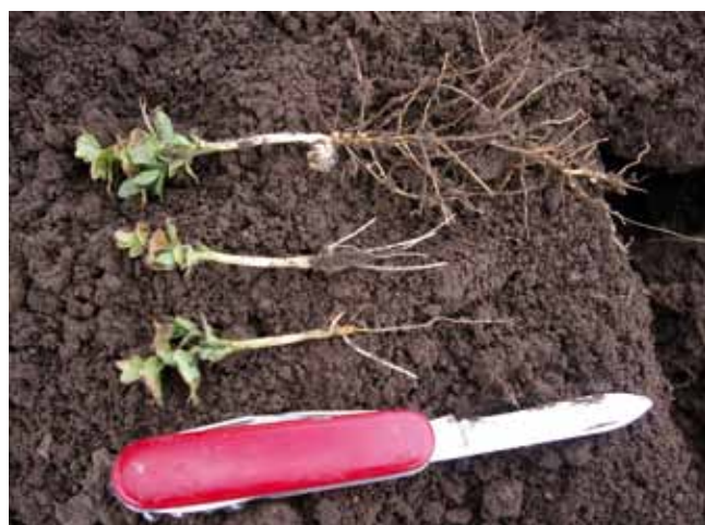
Fußkrankheiten sind der Hauptgrund für die empfohlenen langen Anbauabstände für Körnererbsen.