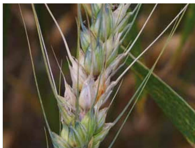
Probleme mit Ährenfusariosen bzw. mit Fusariumtoxinen im Produkt treten im Biokonsumgetreideanbau nur in sehr seltenen Fällen auf.

Aus phytosanitären Gründen sollte der Getreideanteil in der Fruchtfolge im Durchschnitt nicht über 60–70% liegen. Probleme mit Halmbrech, Schwarzbeinigkeit oder Fusarium sind im Biogetreideanbau aufgrund der vielfältigen Fruchtfolgen und der, im Vergleich zum konventionellen System, geringeren Stickstoffintensität eher selten.