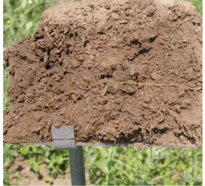
Ein gut durchwurzelbarer Boden steht im Mittelpunkt des Bioackerbaus.

Der Systemansatz des Biolandbaus geht über den einfachen Verzicht auf leicht lösliche Mineraldünger und chemisch-synthetische Pestizide weit hinaus. Im Mittelpunkt steht eine nachhaltige Bodenbewirtschaftung mit dem Ziel, einen belebten, humusreichen Boden zu erreichen, der über eine intensive Durchwurzelbarkeit die Nährstoffversorgung der Pflanze sicherstellen soll (aktive Nährstoffmobilisierung). Der standortgerechte Stickstoffhaushalt wird über den Anbau von Leguminosen sichergestellt. Vorbeugende Pflanzenschutzmaßnahmen, unter anderem auch über eine Förderung der Biodiversität in der Agrarlandschaft, haben absolute Priorität. In der Tierhaltung stehen artgerechte Haltungsformen und artgerechte Fütterung im Mittelpunkt. Im Biolandbau werden keine gentechnisch veränderten Betriebsmittel (Saatgut, Futtermittel, ...) eingesetzt. Zentrales Ziel des Biolandbaus ist die Erzeugung ernährungsphysiologisch und ökologisch hochwertiger Lebensmittel unter möglichst effizientem Einsatz von (nicht erneuerbaren) Ressourcen.