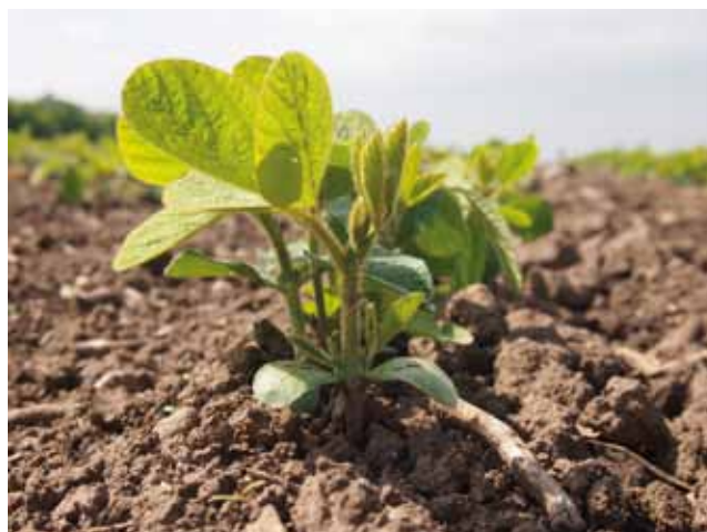
Die Sojabohne weist meist eine negative Stickstoffflächenbilanz auf.

Körnerleguminosen (Körnererbse, Ackerbohne, Wicke, Lupine ...) haben einen geringeren Vorfruchtwert als Futterleguminosen und brauchen Fruchtfolgeabstände von 6 Jahren und mehr als Vorbeuge gegen Fußkrankheiten. Einen Sonderfall stellt die Sojabohne dar, die derzeit noch eine relativ hohe Selbstverträglichkeit aufweist. Andererseits entzieht die Sojabohne über das Erntegut mehr Stickstoff als sie über die Wurzelknöllchen assimiliert, so dass sie im Biolandbau häufig zum Stickstoffzehrer wird.