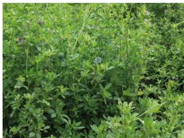
Klee grasbestände bringen vielfältige Leistungen für die Bodenfruchtbarkeit.

Verhinderung von Nährstoffauswaschung und Bodenabtrag