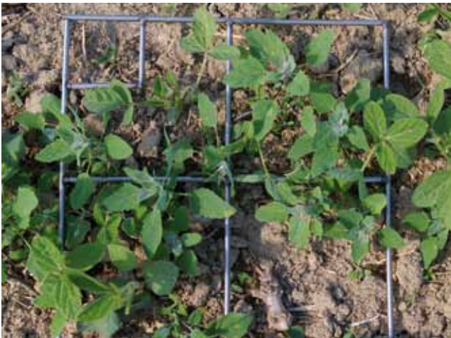
Der weiße Gänsefuß ist ein konkurrenzstarker Wärmekeimer. In einem Wintergetreidebestand kann sich diese Art in der Regel nicht etablieren.

Einjährige Unkräuter können gemäß ihrer Keimbologie grob in Herbstkeimer, Frühjahrskeimer und Wärme- bzw. Spätfrühjahrskeimer eingeteilt werden 1 und sind demgemäß eher an Winterungen oder Sommerungen angepasst. Durch den regelmäßigen Wechsel von Winterung und Sommerung kann daher eine einseitige Selektion bestimmter Beikrauttypen verhindert werden. Generell ist eine vielfältige Beikrautflora ohne dominante Arten leichter vorbeugend zu regulieren als durch falsche Bodenbearbeitung oder Fruchtfolgegestaltung selektierte „Problemunkrautsituationen“.