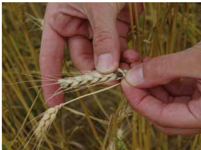
Steinbrandähren setzen beim Drusch die Sporen frei. Steinbrandbelastetes Erntegut wird in der Bio-Lagerstelle nicht übernommen!

Auch die Wahl der richtigen Sorte ist im Biolandbau ein Grundpfeiler des pflanzenbaulichen Erfolgs. Über die Nutzung der vorhandenen Krankheitsresistenzen lassen sich viele Pflanzenschutzprobleme vorbeugend lösen.