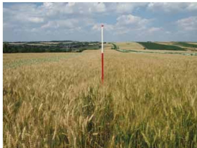
Die alte Sorte Capo (links im Bild) ist seit vielen Jahren im Biolandbau erfolgreich. Die neuere Züchtung Tobias (rechts im Bild) übertrifft Capo im Kornproteingehalt deutlich.

Zusätzlich hilft die Wahl der richtigen Sorte dabei, die Qualitätsanforderungen in der Biovermarktung leichter zu erreichen.