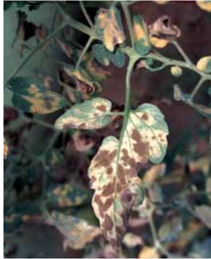
Befallsbild blattoberseite

Auf den Blattoberseiten bilden sich unscharf begrenzte, gelbliche Flecken. Diese weisen auf der Unterseite einen samtartigen, braunen Belag (Myzel, Konidienträger und Konidien) auf. Die Blattspreiten, beginnend an den älteren Blättern, können nach und nach absterben. Blattstiele und Stängel werden nicht befallen (Bedlan, 2012). Früchte zeigen nur sehr selten einen Befall.