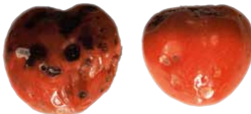
Befall an Früchten

Bei einer Luftfeuchtigkeit von 85 % und darüber dringen die Konidien über die Stomata in die Blätter ein, am schnellsten geschehen Infektionen bei Luftfechtigkeiten zwischen 85 % tagsüber und 100 % während der Nachtstunden (Anonym, 1989).