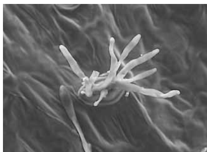
Konidienträger wachsen aus einem Stoma (REM)

Cladosporium fulvum bildet Pathotypen aus, z. B. die Pathotypengruppen A, B, C, D und E. Bei der Angabe zur Resistenz bedeutet C1 resistent gegen Pathotypengruppe A, C2 resistent gegen Pathotypengruppe A und B, C3 resistent gegen Pathotypengruppe A, B und C, C4 resistent gegen Pathotypengruppe A, B, C und D, C5 resistent gegen Pathotypengruppe A, B, C, D und E.