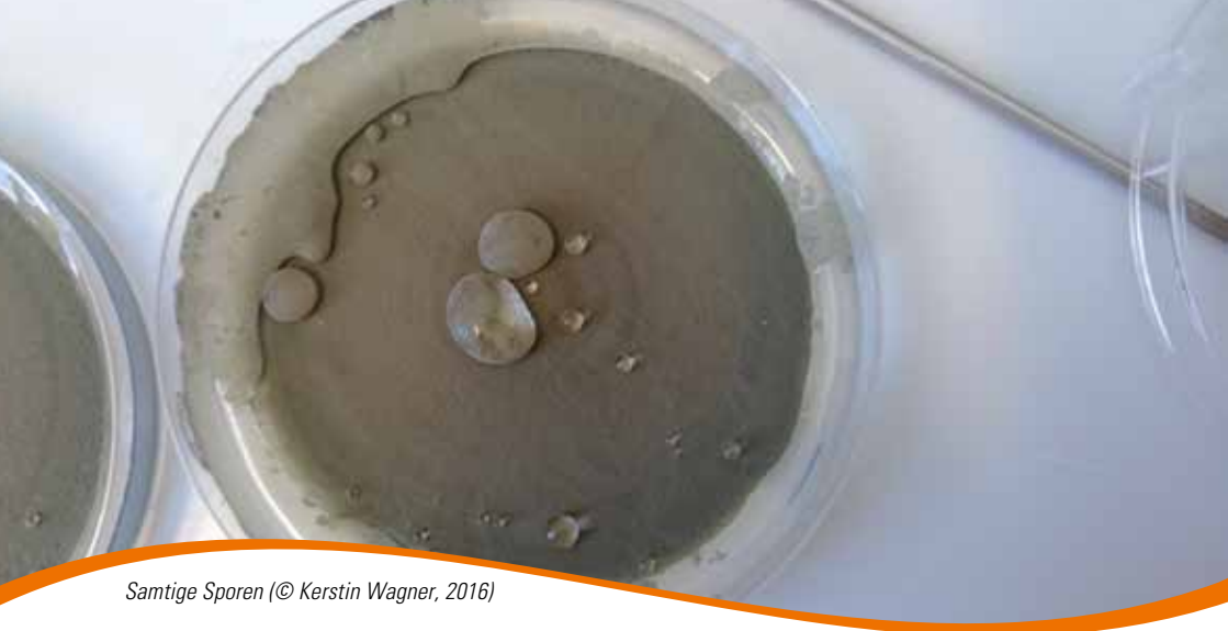
Samtige Sporen