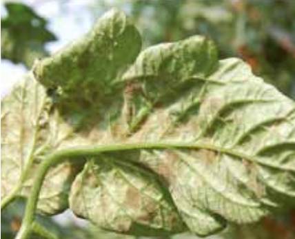
Befallenes Blatt mit typischer Symptomatik der Samtfleckenkrankheit bei Endbonitur am Standort im Bezirk Bad Radkersburg

gewählten Pflanzenschutz- und -stärkungsmittel erfolgte mittels manuell bedienbarer Rückenspritze. Aufgrund der Ausbreitungsbiologie von Passalora fulva wurde besonders darauf geachtet, die Blattunterseite gut zu besprühen. Um die Benetzung zu dokumentieren wurde eine Spritzbildanalyse mittels Water-Sensitive-Paper durchgeführt. Eine Konstruktion mit Gewebepflanen schützte während der Applikation die Nachbarreihen im Tomatenbestand vor der unerwünschten Verfrachtung von Sprühnebel.