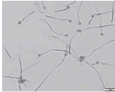
Hyphen und Sporen in der Kontrollvariante