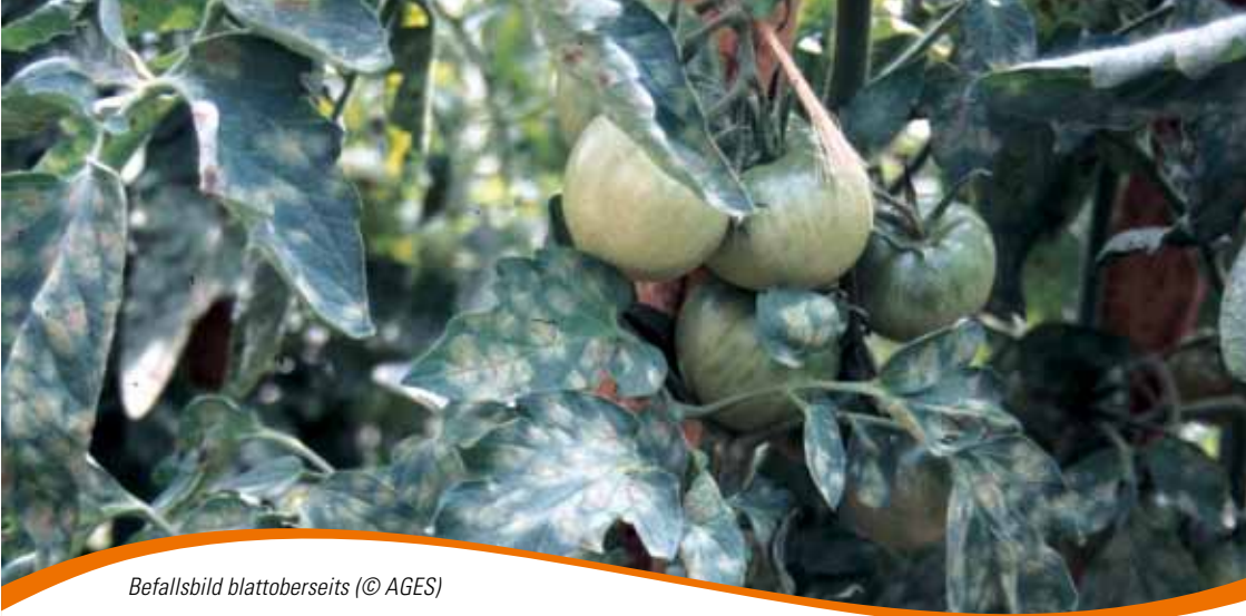
Befallsbild blattoberseits