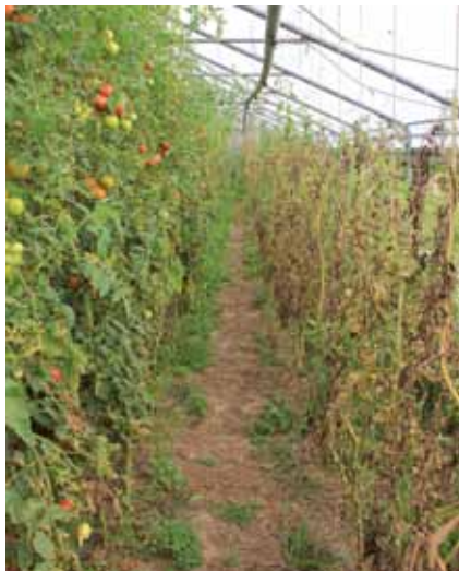
Vollständige Resistenz durch monogene Resistenzzüchtung: links eine resistente Sorte, rechts eine anfällige Sorte

Derartige monogene HR-Resistenzen sind in der Züchtung einfach handzuhaben und bringen rasche Erfolge. Der Haken an der Sache ist jedoch, dass sie in vielen Fällen nur kurzfristig funktionieren. Durch Mutationen kann es nämlich vorkommen, dass sich das Pilzgenom verändert und der Pilz jenes Protein, das für die Erkennungsreaktion entscheidend ist, nicht mehr produziert. Dadurch wird der Pilz von der Pflanze nicht mehr erkannt, die Abwehrreaktion bleibt aus. Sofern das nun fehlende Pilzprotein die Fähigkeit des Pilzes die Tomatenpflanze zu befallen, nicht relevant einschränkt, besitzt die neuentstandene Pilzrasse einen entscheidenden Fitnessvorteil. Da sie nun auch bisher resistente Pflanzen befallen kann, breitet sie sich in der Regel rasch aus. In der Tat wurden derartige Resistenzdurchbrüche in der Vergangenheit zahlreich dokumentiert.