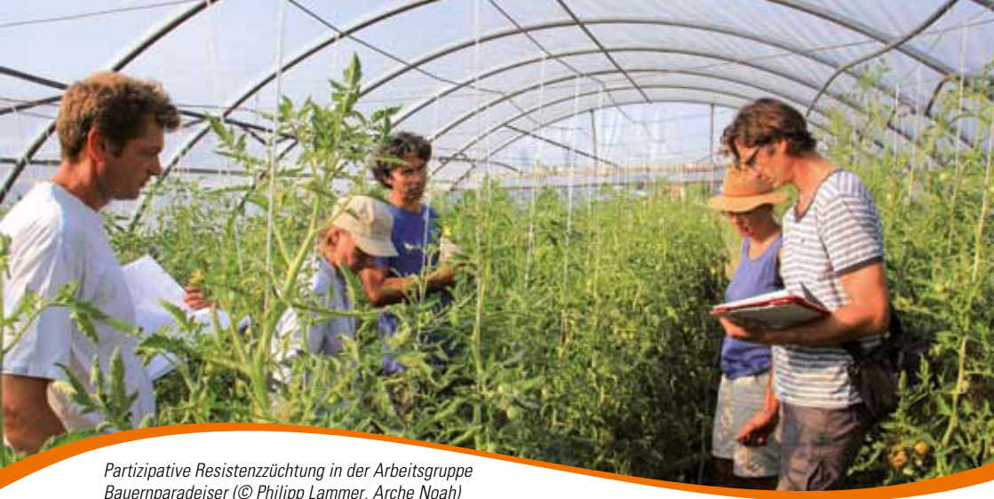
Partizipative Resistenzzüchtung in der Arbeitsgruppe Bauernparadeiser